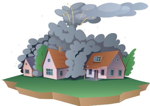
FUITE TOXIQUE OU INCENDIE SUR SITE INDUSTRIEL